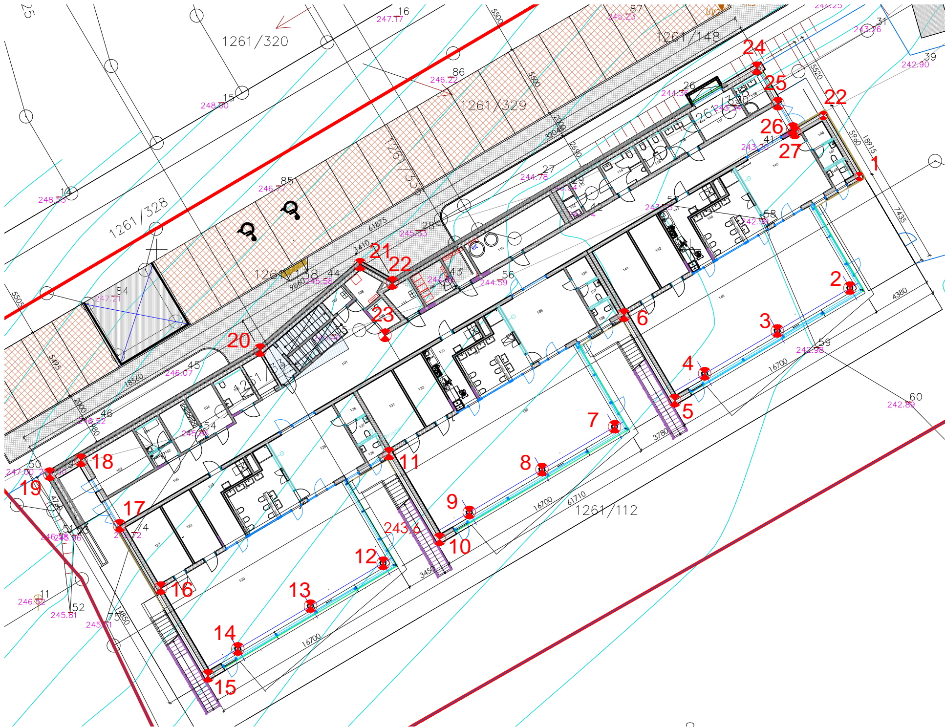
SOUŘADNICE JTSK :